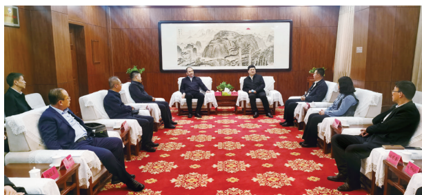
孙波与南开区区长聂伟迅会谈